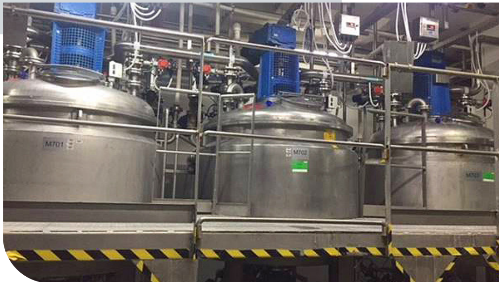
Die drei Mischer bei Canan Kozmetik